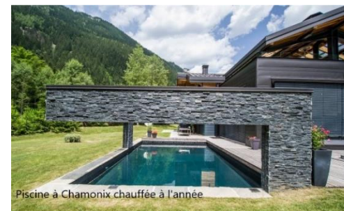
Piscine à Chamonix chauffée à l'année